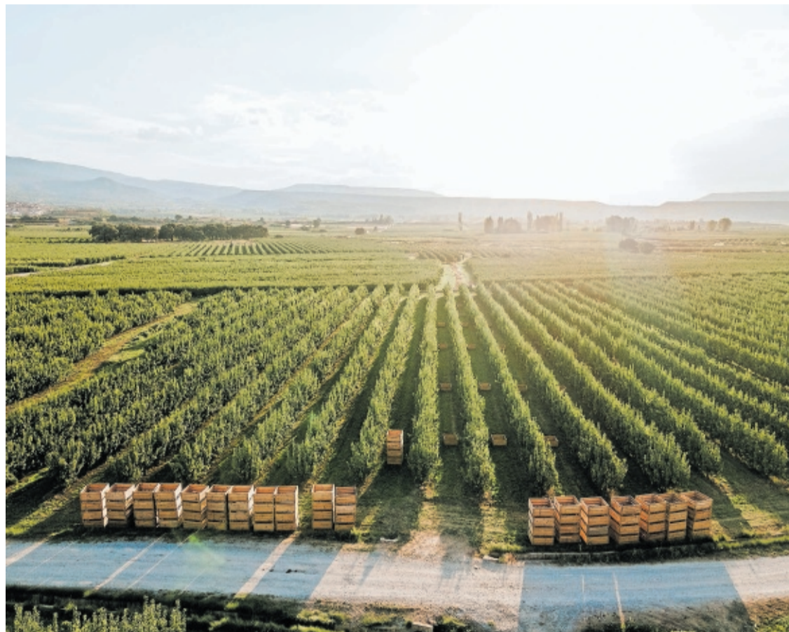
Perales en plena etapa de recogida en La Rioja.