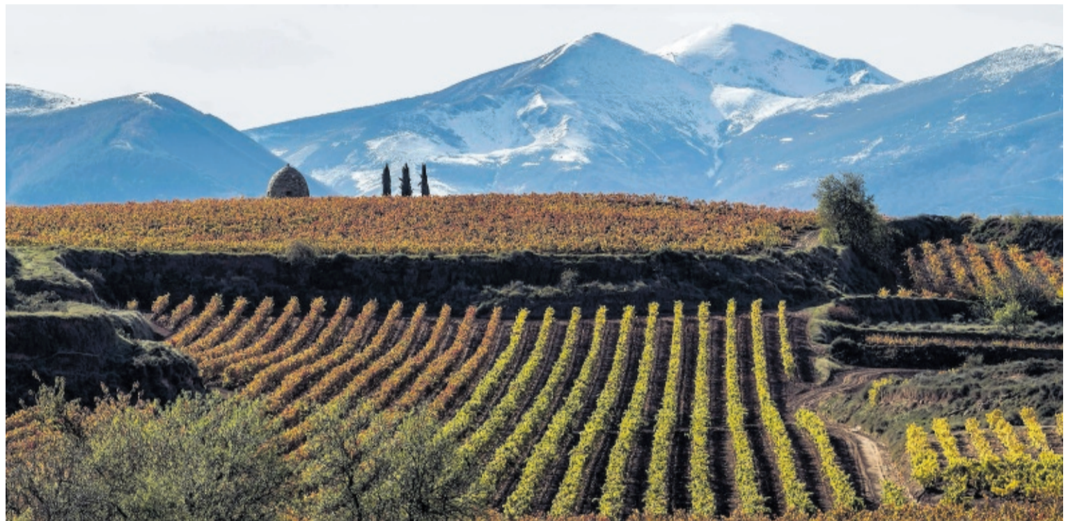
Viñedo en Badarán con el San Lorenzo nevado al fondo.