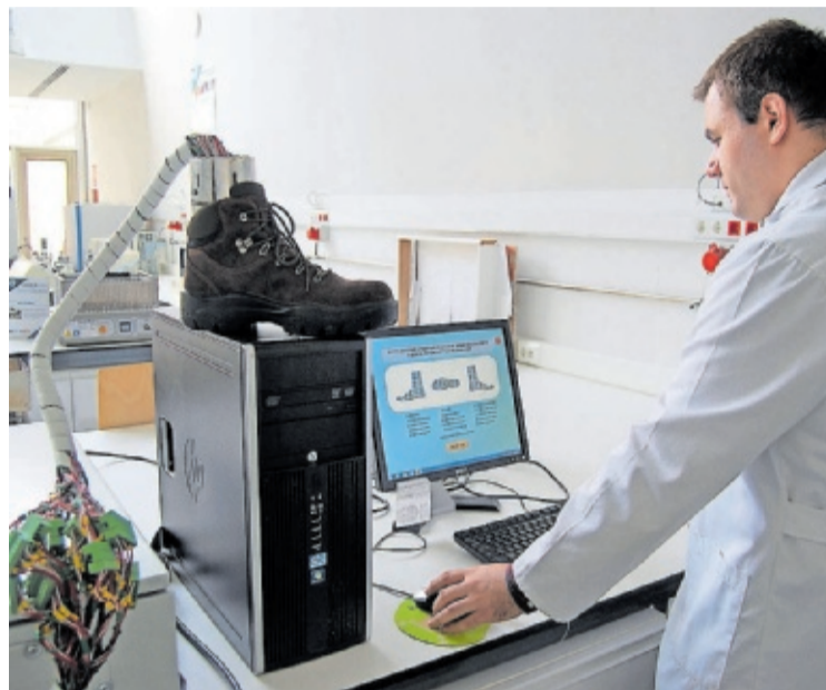
Centro tecnológico de calzado en Arnedo.

La contribución al PIB de la segunda es del 6,5% y solo en empleo directo supera las 12.200 personas, según el estudio sobre La relevancia económica del sector vitivinícola en La Rioja , elaborado por Analistas Financieros Internacionales