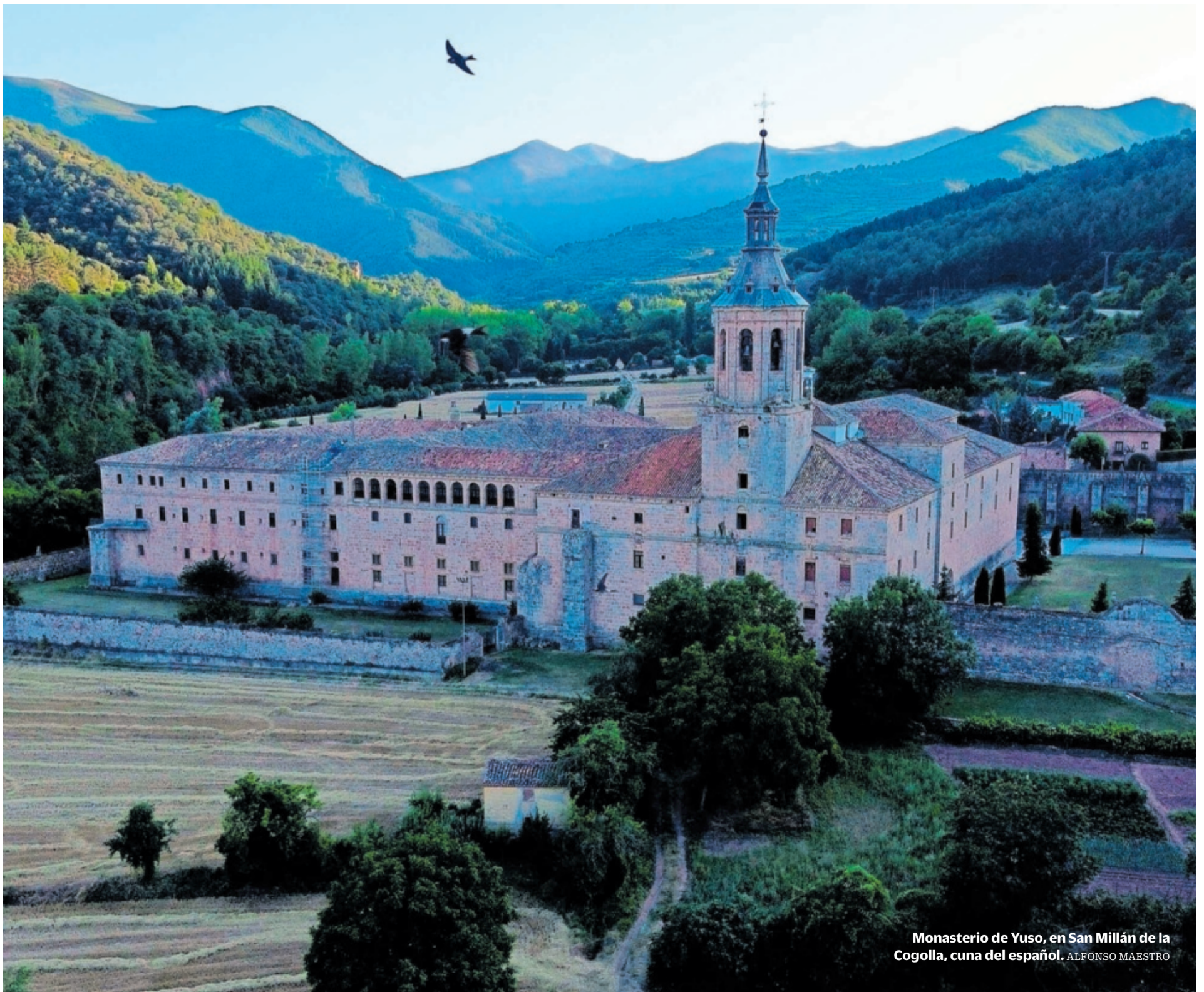
Monasterio de Yuso, en San Millán de la Cogolla, cuna del español. ALFONSO MAESTRO

La innovación agroalimentaria, tecnológica, del calzado o la automoción abre caminos en la diversificación industrial más allá de la viticultura, que vive una crisis ▶ La región crece a buen ritmo y marca récord en afiliados a la Seguridad Social ▶ Las exportaciones siguen disparadas