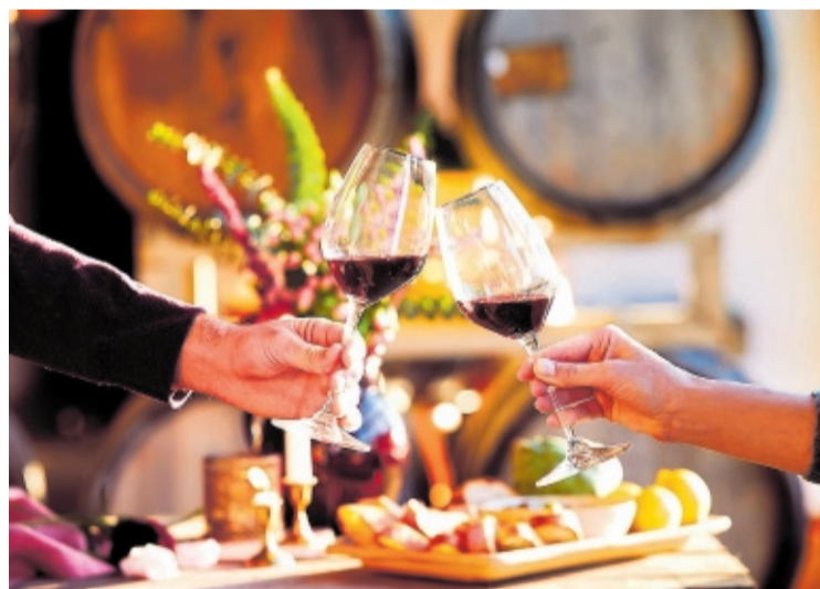
Brindis con vino tinto.

El Museo Vivanco, en Briones, es un emblema de la cultura del vino