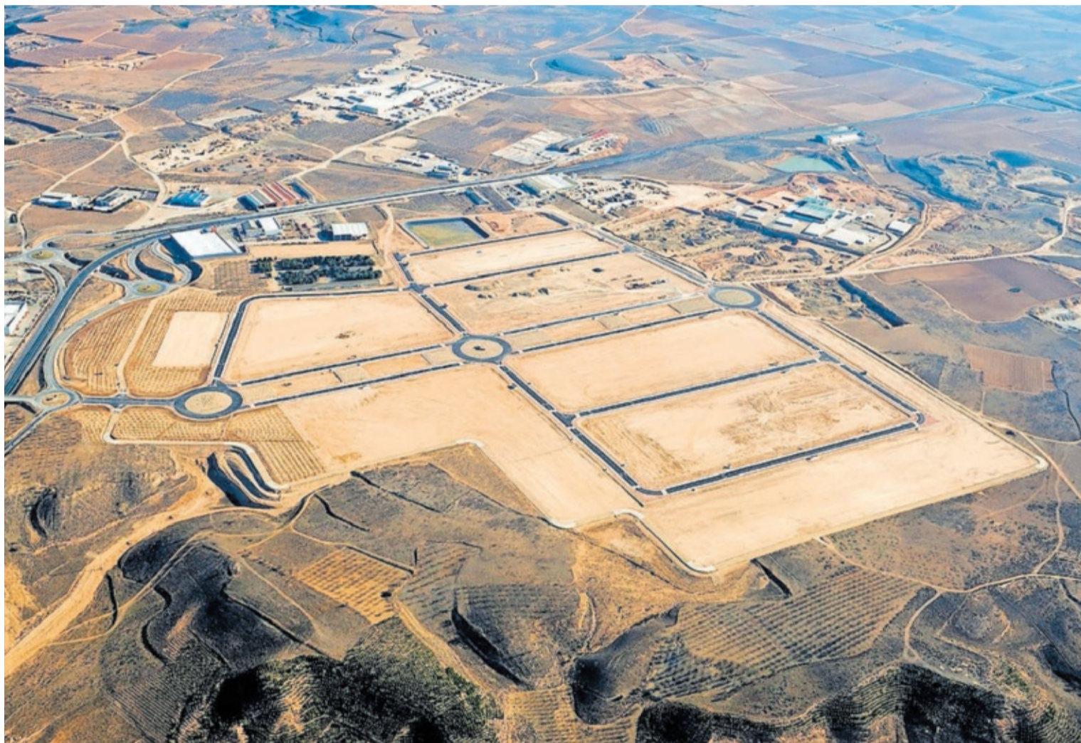
VISTA DEL TERRENO QUE ALBERGARÁ EL PARQUE EMPRESARIAL LA SENDA, EN EL MUNICIPIO DE ALFARO.

A esta inversión se suma el compromiso de Ader, que ha puesto a disposición de las empresas interesadas un paquete de ayudas económicas que abaratan considerablemente el coste de la instalación en el polígono.