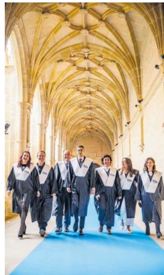
RECTORADO DE LA UNIVERSIDAD EN LOGROÑO. A LA DERECHA, IMAGEN DE UNOS ESTUDIANTES RECIÉN GRADUADOS. UNIR