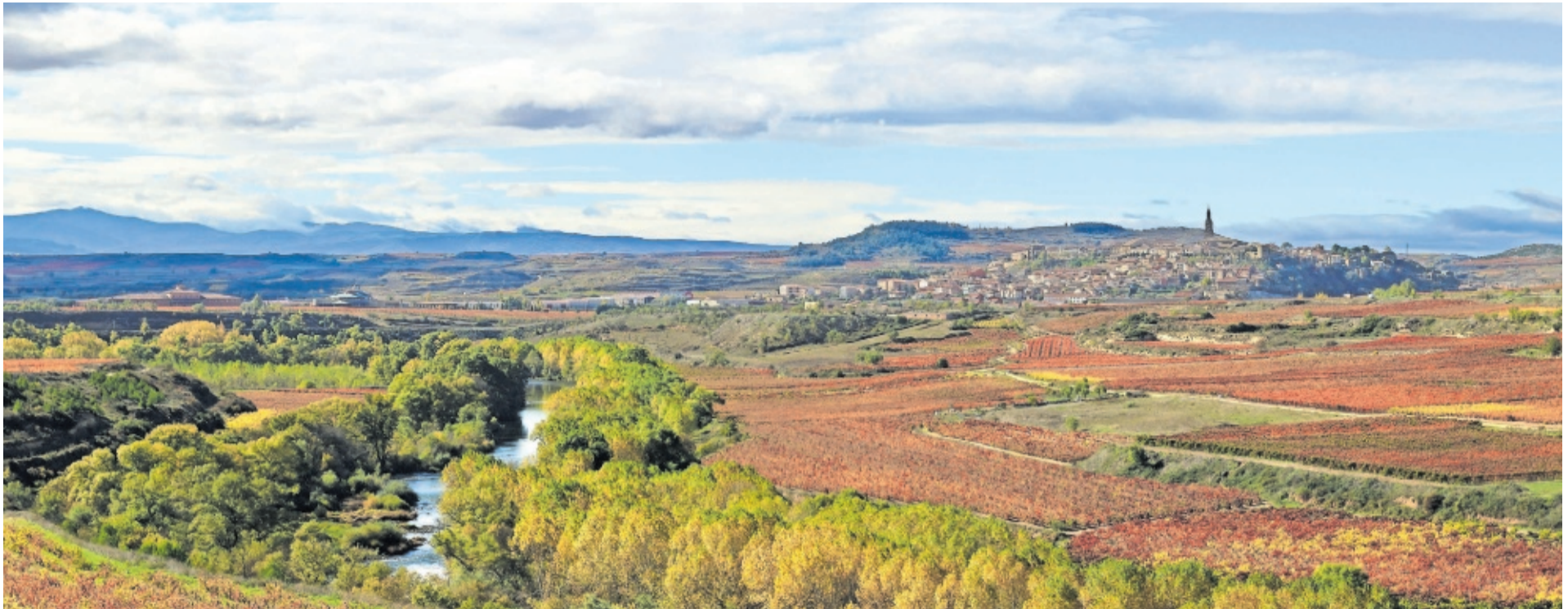
VISTA DEL PUEBLO DE BRIONES, EN LA RIOJA. DANIEL ACEVEDO