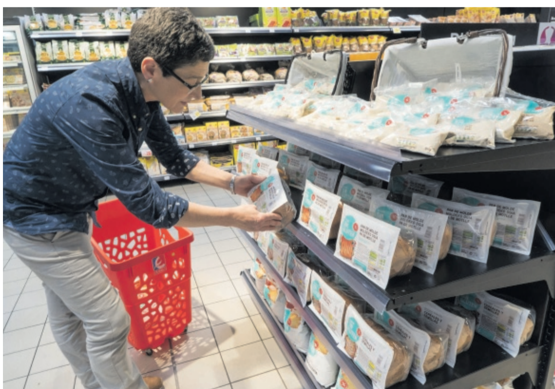
IMAGEN DE LOS PRODUCTOS SIN GLUTEN Y, ARRIBA, LOS ARTÍCULOS DE PROVEEDORES LOCALES QUE OCUPAN UN LUGAR DESTACADO EN LAS TIENDAS.

El compromiso de la entidad con la región se manifiesta también en sensibilizar a los jóvenes riojanos sobre la importancia de una alimentación equilibrada y su