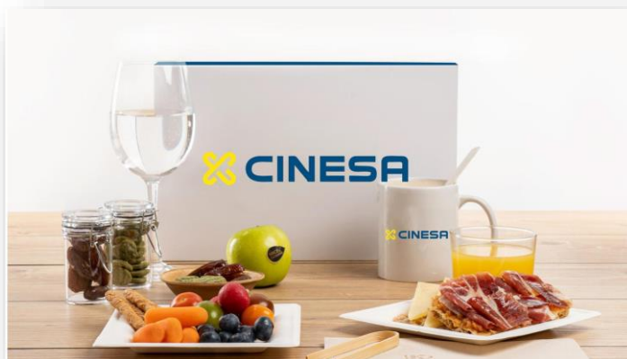
Ejemplos de customización de envases de catering para evento.