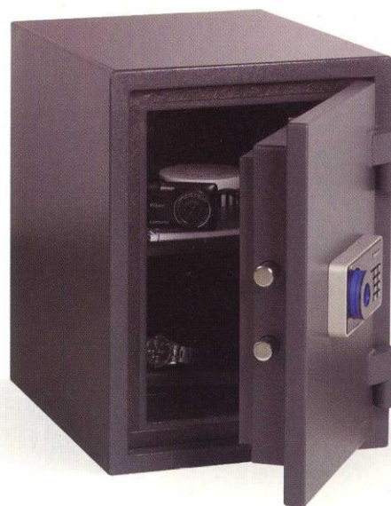
Modelo: Fire 25