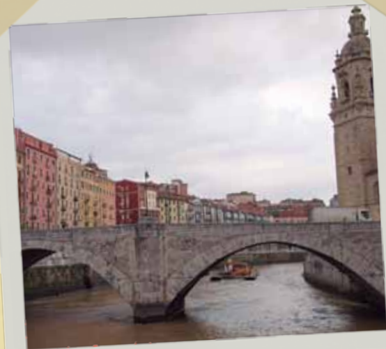
San Anton zubia Puente de San Antón

Un Bilbao cuyas relaciones comerciales se expandían gracias a su puerto y a sus conexiones ferroviarias. Unamuno, como él mismo dijo, gustaba de escribir acerca de la vida cotidiana, las personas “que comen, beben y juegan”, lo que nos da una visión del Bilbao costumbrista de su infancia, presente en una de sus pocas obras que transcurren en Bilbao, escrita en 1897, “Paz en la guerra”. Pasaremos por varios escenarios que se nombran en dicha obra. La zona que hemos elegido visitar es la de Atxuri como paradigma del Bilbao comerciante, la llegada de mercancías, por la ría, en tren... Todo ese Bilbao que Unamuno admiraba cuando subía a Miribilla, entonces conocido como Miravilla, y se deleitaba admirando su “botxito”.