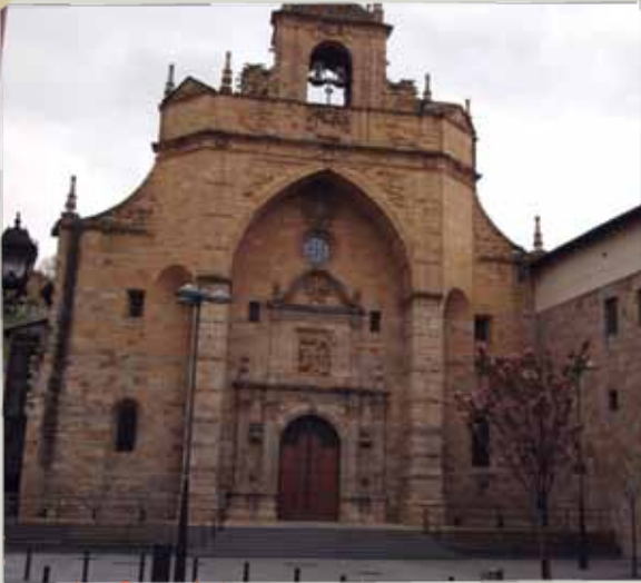
Enkarnazio-Eliza. Atxuri Iglesia de la Encarnación. Atxuri

Bilboko Udalaren Kultura eta Hezkuntza Sailak, ondarea zabaltzeko Bilbao Izan programaren bidez eta Miguel de Unamunoren heriotzaren 75. urteurrena dela eta, Bilboko idazle eta filosofo ospetsu honen bizitzan korapilatzen eta erakusten diren uriko leku ezberdinak ezagutu eta miatzeko aukera ematen dizu. Horretarako maiatzean, ekainean eta irailean egingo diren bisita gidatuen hiru ibilbide diseinatu ditugu.