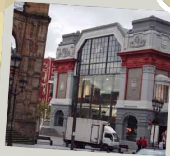
Erriberako Merkatua Mercado de la Ribera