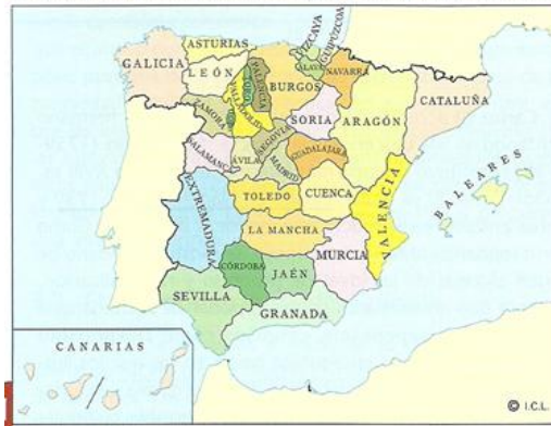
ESTRUCTURA ADMINISTRATIVA DE LA ESPAÑA DEL SIGLO XVIII

Fuente: VICENS VIVES, J.: Historia económica de España , 1972.