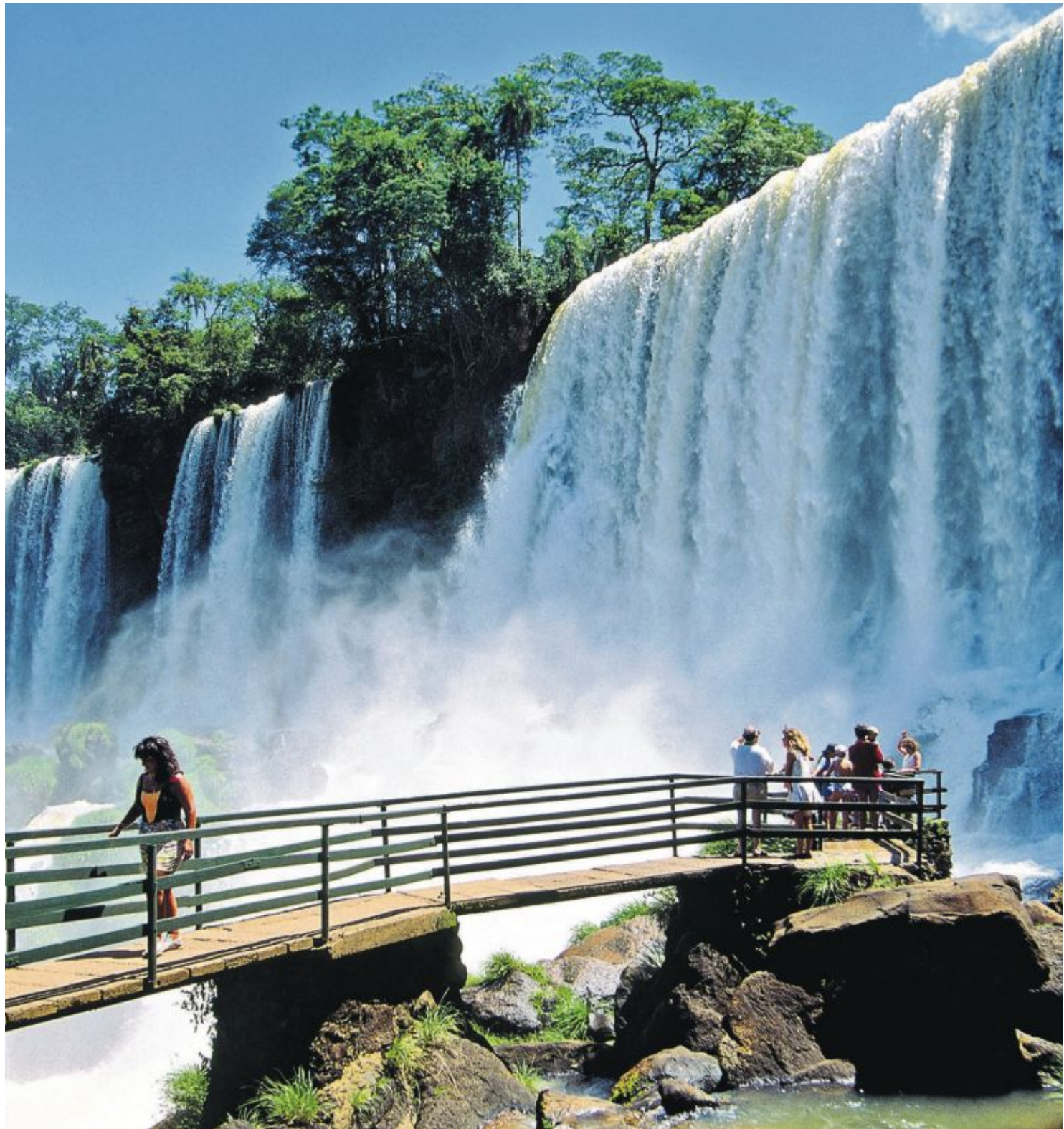
Las cataratas de Iguazú, en la confluencia de Argentina, Paraguay y Brasil.

El fundador de Asunción en 1537, Don Juan de Salazar, natural de Espinosa de los Monteros (Burgos), tiene una estatua en la Plaza de Armas. Más apartado se encuentra un monolito con la fecha de 1813. Conmemora la independencia de España pero también de Argentina. Los paraguayos combatieron a los ejércitos argentinos y el Congreso eligió un cargo estupefaciente: Dictador Supremo. José Gaspar Rodríguez de Francia, quien lo ejerció hasta su muerte de modo personalista y autárquico, blindó el país, cerró las fron-