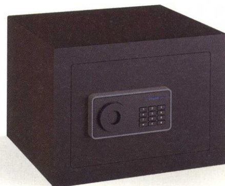
Modelo: Water 30