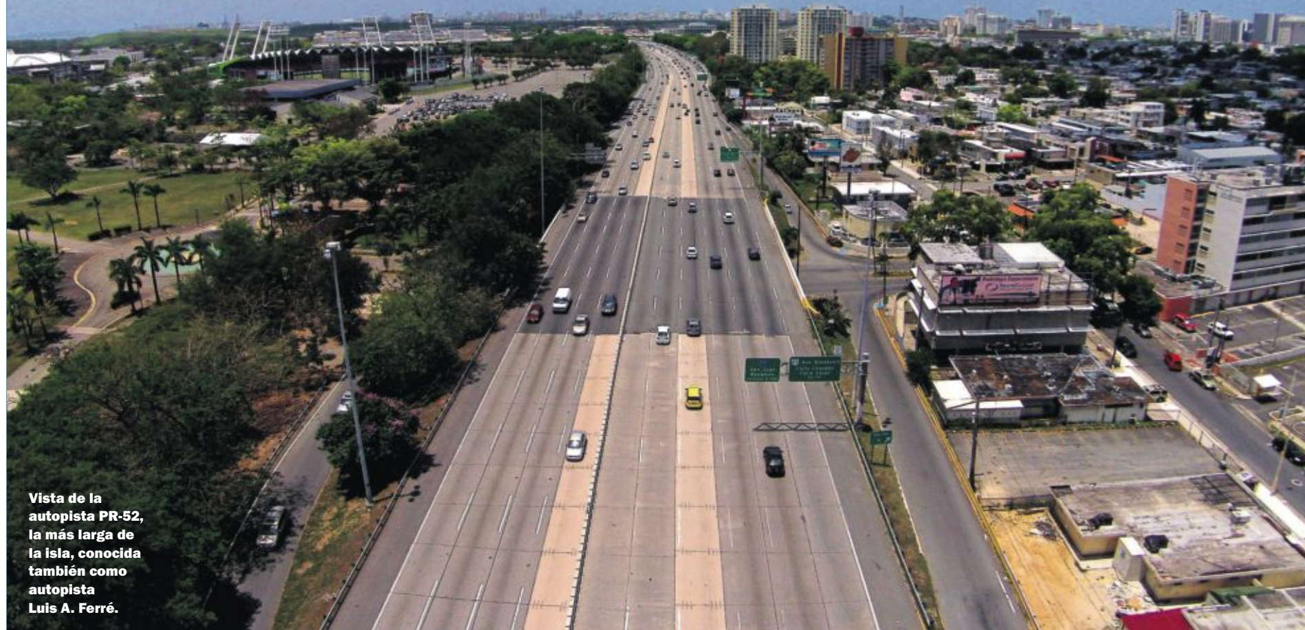
Vista de la autopista PR-52, la más larga de la isla, conocida también como autopista Luis A. Ferré.

LA ADMINISTRACIÓN TIENE PROYECTOS PARA RENOVAR UNA RED DE INFRAESTRUCTURAS QUE SE ENCUENTRA ENTRE LAS MEJORES DEL CARIBE