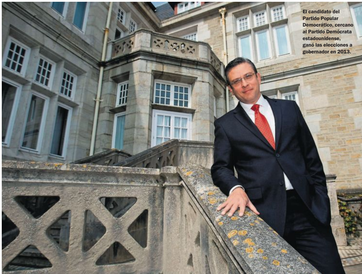
El candidato del Partido Popular Democrático, cercano al Partido Demócrata estadounidense, ganó las elecciones a gobernador en 2013.