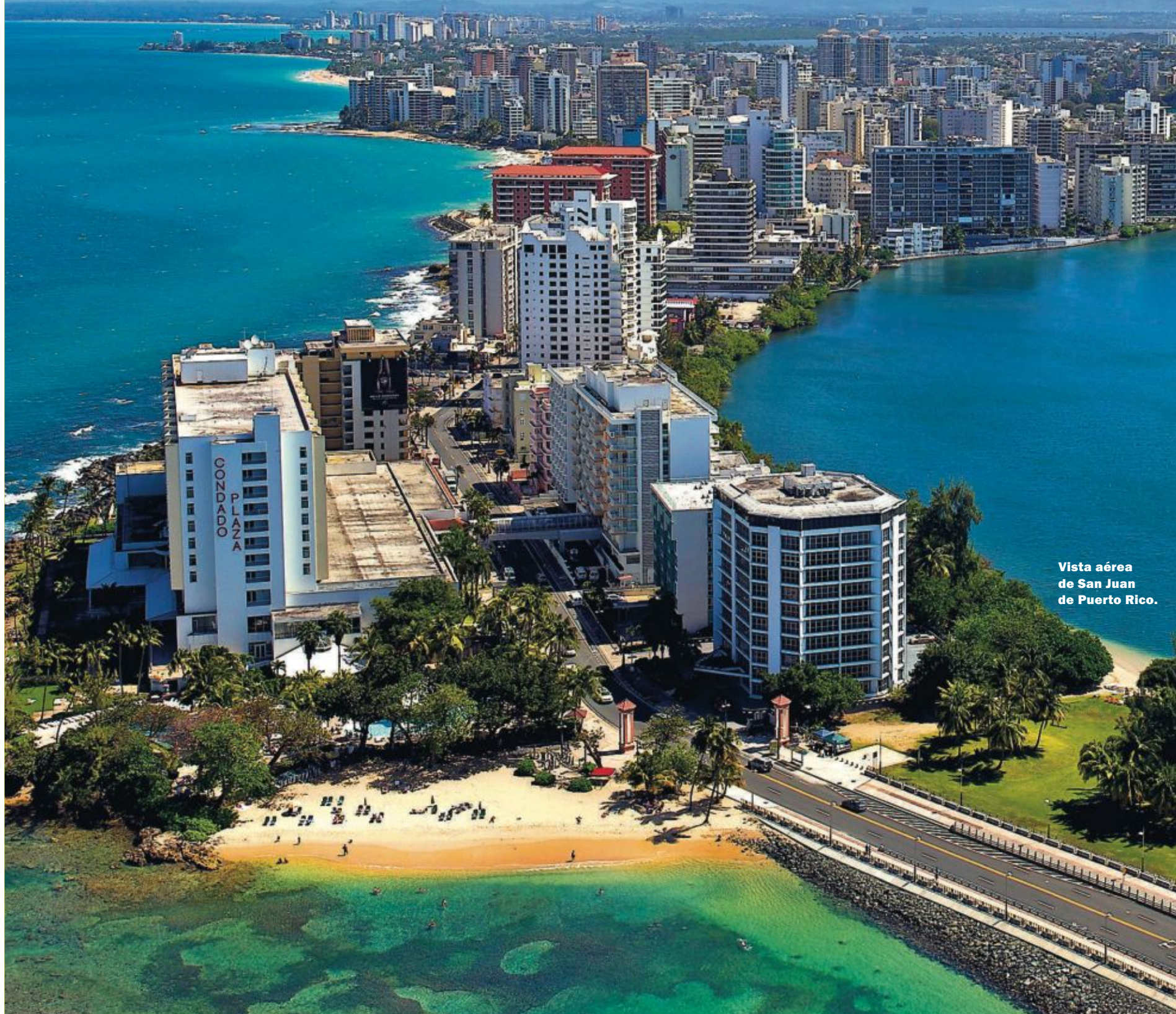
Vista aérea de San Juan de Puerto Rico.

HOJA DE RUTA PARA CRECER. La isla mantiene su deseo de construir una Arcadia en el Caribe y dejar atrás ocho años de crisis. El gobernador Alejandro García Padilla apuesta por un ambicioso plan para reindustrializar el territorio, reducir el déficit y detener la diáspora a Estados Unidos. Páginas 2 y 3