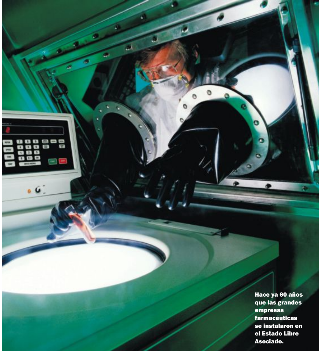
Hace ya 60 años que las grandes empresas farmacéuticas se instalaron en el Estado Libre Asociado.

EL 50% DE LOS MARCAPASOS Y DESFIBRILADORES DEL MUNDO SE FABRICAN EN EL PAÍS. Y LOS PRINCIPALES LABORATORIOS ELABORAN ALLÍ SUS MEDICAMENTOS