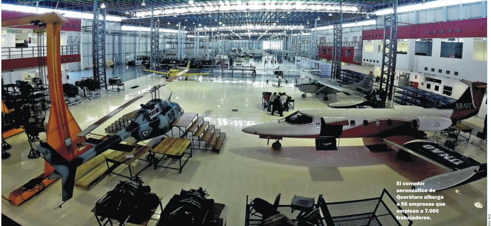
El corredor aeronáutico de Querétaro alberga a 56 empresas que emplean a 7.000 trabajadores.

MEXICANO TOMA IMPULSO GRACIAS A UN POTENTE PARQUE INDUSTRIAL EN QUERÉTARO