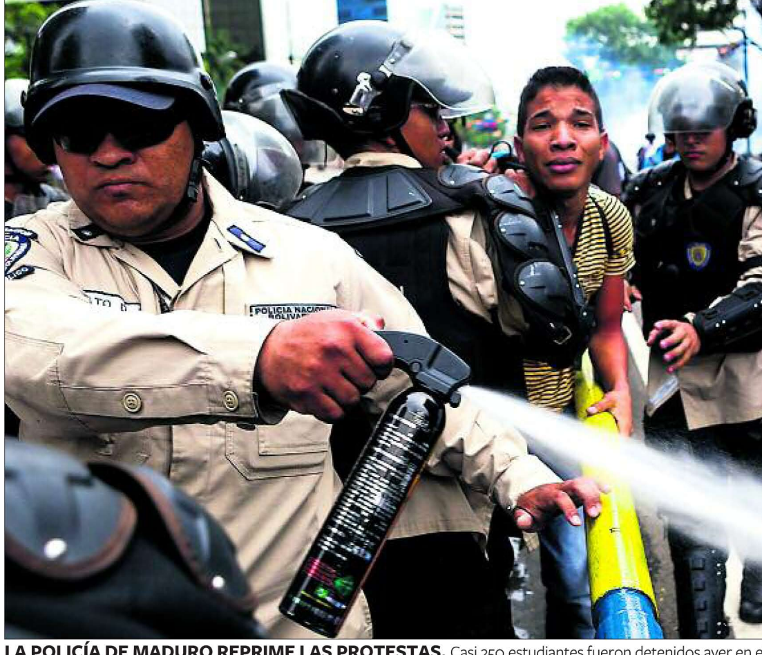
LA POLICÍA DE MADURO REPRIME LAS PROTESTAS. Casi 250 estudiantes fueron detenidos ayer en el desalojo de varios campamentos levantados en Caracas contra la política del Gobierno venezolano. En la foto, varios agentes retienen a un manifestante a favor del líder opositor Leopoldo López. PÁGINA 6