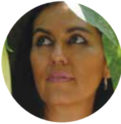
Jacinta Escudos El Salvador

Escritora. Ha cultivado los géneros de novela, cuento, crónica y ensayo. Ganadora del I Premio Centroamericano de Novela “Mario Monteforte Toledo” (2003), con su novela A-B-Sudario . En 2011 la Feria Internacional del Libro de Guadalajara la nombró uno de “Los 25 secretos mejor guardados de Latinoamérica”, cuyo trabajo merece ser reconocido fuera de las fronteras de su país.