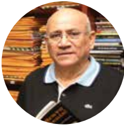
Edgar Tijerino Nicaragua

Inició como cronista deportivo en La Prensa en 1970, luego en Radio Corporación y el Canal 2. Fue Jefe de deportes de La Prensa, El Nuevo Diario y Barricada. Laboró en el Canal 6 y fundó Doble Play en 1981 en La Voz de Nicaragua. Ha publicado tres libros sobre deportes: El Mundial Nica , 1973; El Flaco Explosivo , 1975; Doble Play , 1986. Considerado uno de los periodistas deportivos más destacados e influyentes entre el gremio de nicaragüenses, manifiesta en sus escritos una mezcla de deporte, política, música, historia y literatura con algo de humor y filosofía.