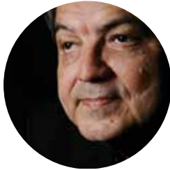
Sergio Ramírez Nicaragua

Fundó la revista Ventana en 1960, y encabezó el movimiento literario del mismo nombre. En 1968 fundó la Editorial Universitaria Centroamericana (EDUCA). Presidió el Consejo Nacional de Educación y fundó la Editorial Nueva Nicaragua en 1981. Con una bibliografía de treinta títulos, con Margarita, está linda la mar (1998) ganó el Premio Internacional de Novela Alfaguara 1998, otorgado por un jurado presidido por Carlos Fuentes, y el Premio Latinoamericano de Novela José María Arguedas 2000, otorgado por la Casa de las Américas, en Cuba. Por su trayectoria literaria mereció el Premio Iberoamericano de Letras José Donoso, en 2011.