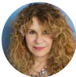
Gioconda Belli Nicaragua

Su obra incluye poesía, novela, una memoria y un cuento para niños. Entre sus novelas destaca La Mujer Habitada (Premio de la Fundación de Libreros, Bibliotecarios y Editores Alemanes y el Premio Anna Seghers de la Academia de Artes de Alemania) y Waslala (1996). Su memoria El país bajo mi piel (2001) fue nominado como uno de los mejores libros del año por Los Angeles Times. Con El Infinito en la palma de la mano (2008) obtuvo el Premio Biblioteca Breve y el Premio Sor Juana Inés de la Cruz. En 2010, su novela El país de las mujeres recibió el Premio Hispanoamericano “La Otra Orilla”.