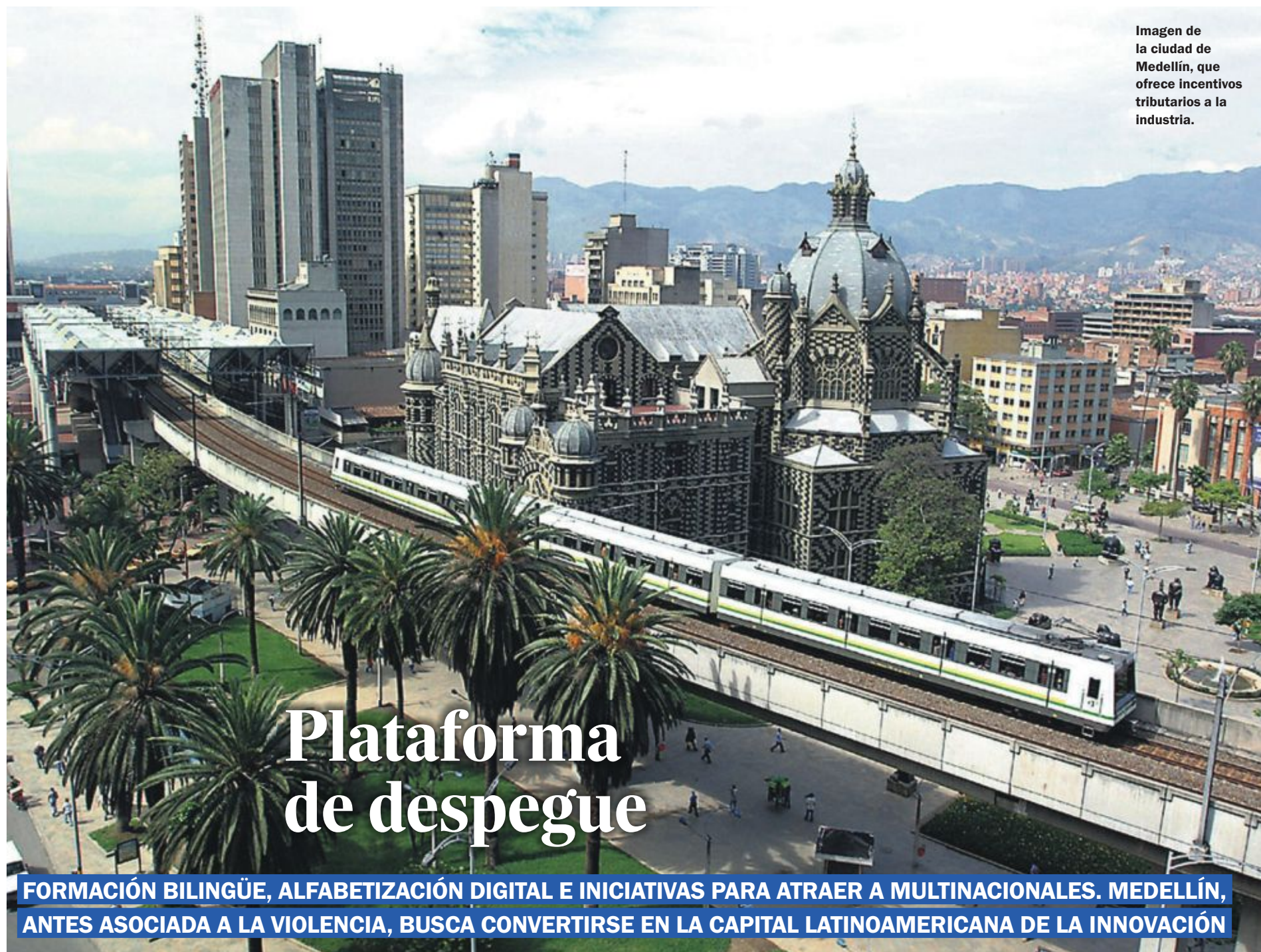
Imagen de la ciudad de Medellín, que ofrece incentivos tributarios a la industria.