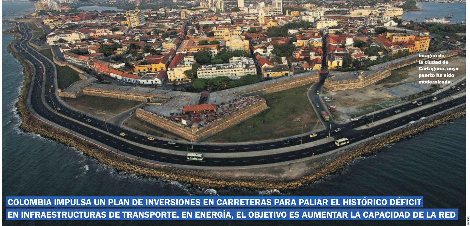
Imagen de la ciudad de Cartagena, cuyo puerto ha sido modernizado.

COLOMBIA IMPULSA UN PLAN DE INVERSIONES EN CARRETERAS PARA PALIAR EL HISTÓRICO DÉFICIT EN INFRAESTRUCTURAS DE TRANSPORTE. EN ENERGÍA, EL OBJETIVO ES AUMENTAR LA CAPACIDAD DE LA RED