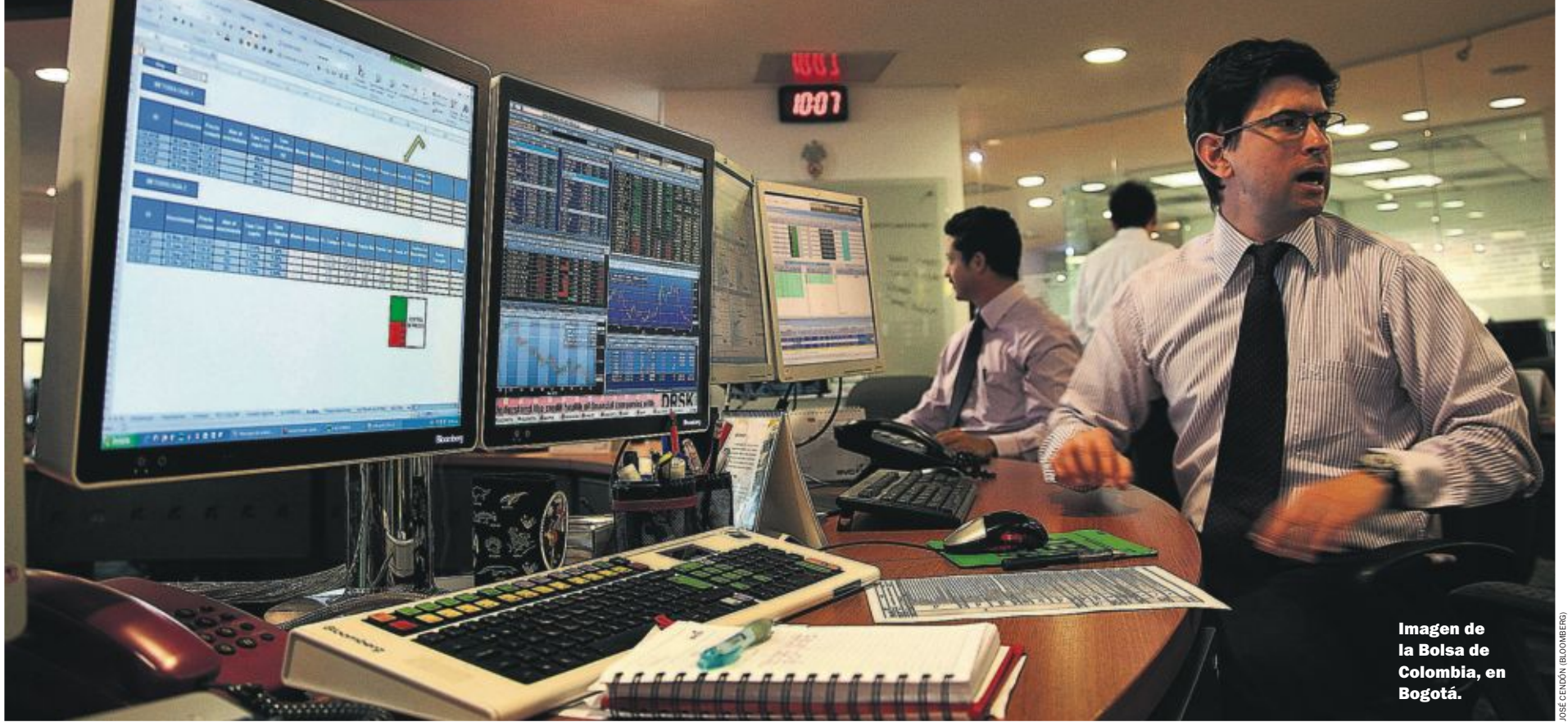
Imagen de la Bolsa de Colombia, en Bogotá.

COLOMBIA DESARROLLA ESTOS DÍAS UNA OFENSIVA EN TODOS LOS FRENTES PARA CONVERTIRSE EN UN PAÍS PUNTERO EN EL USO SOCIAL Y APROVECHAMIENTO EMPRESARIAL DE LAS NUEVAS TECNOLOGÍAS