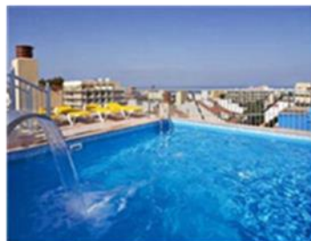
Activos hoteleros en costa e islas