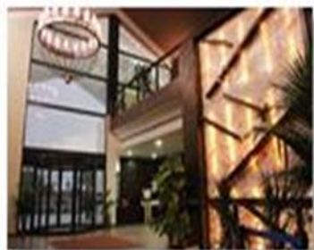
Activos hoteleros de interior