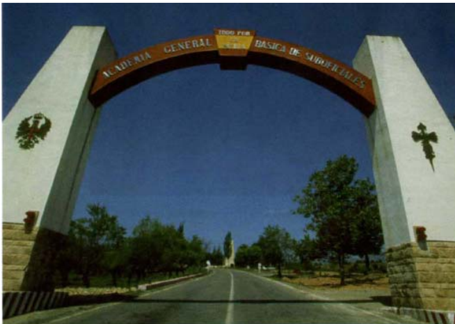
Entrada principal de la AGBS

En resumen, la Ley trata de conseguir el máximo nivel de eficacia en el cumplimiento de las misiones del Ejército de Tierra y proporcionar la debida igualdad de oportunidades, haciendo que los ascensos no dependan exclusivamente de la antigüedad y