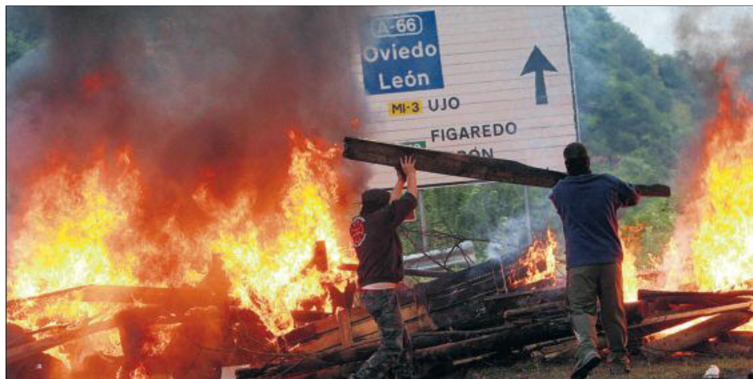
BARRICADAS, HERIDOS Y DETENIDOS EN EL CONFLICTO DE LOS MINEROS DE ASTURIAS. Seis personas fueron detenidas y cuatro sufrieron heridas en los incidentes registrados en las últimas horas entre los mineros y las fuerzas de seguridad en Aller y Pola de Lena. Entre las víctimas está una niña alcanzada en su casa por una pelota de goma. En la foto, barricadas cerca de Aller. PÁGINA 17

Tras 60 años de temor, los vecinos de Navia de Suarna, en Lugo, saben al fin que sus casas no serán anegadas por el agua. Medio Ambiente dio carpetazo, por su impacto ecológico, al proyecto de una presa aprobada en la dictadura y que se tramitaba desde 1951. Iba a afectar a tres municipios entre Asturias y Galicia. PÁGINA 32