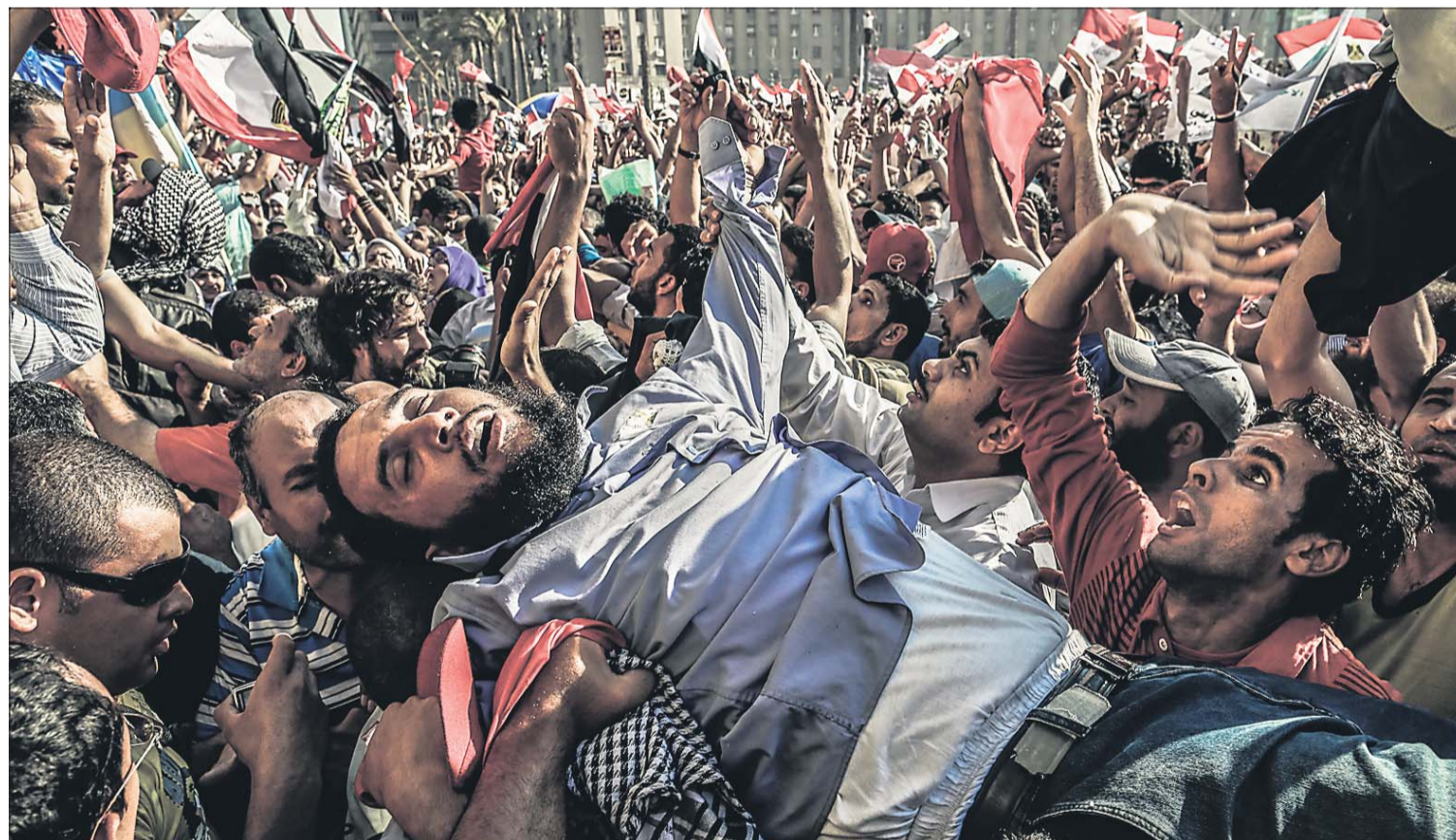
Un seguidor de los Hermanos Musulmanes se desvanece durante la celebración en la plaza de Tahrir del triunfo de Morsi.

El Gobierno turco anunció ayer que tomará medidas contundentes para responder al derribo de uno de sus aviones por parte del Ejército sirio el pasado viernes. Turquía sostiene que el avión fue derribado en aguas internacionales y no dentro del espacio aéreo sirio, como afirmó el viernes el Ejército de Bachar el Asad. La OTAN ha convocado de urgencia una reunión a petición de Turquía, que invocó el artículo 4 del Tratado de Washington, que reclama consultas entre los aliados en caso de que uno de ellos se sienta amenazado. PÁGINA 4