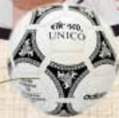
Balón que se utilizó en la Eurocopa de 1992.

Croacia se clasificó por primera vez para una Eurocopa tras declarar la independencia de la antigua Yugoslavia.