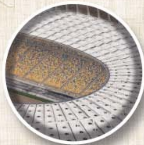
ESTADIO OLÍMPICO (Kiev) Apertura 1923 Aforo 60.000