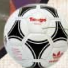
Balón que se utilizó en la Eurocopa de 1984.

Alemania Federal perdió por 0-1 contra Irlanda del Norte en su primera derrota en casa en un partido de clasificación después de 29 partidos.