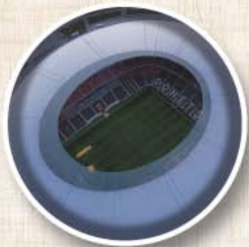
DONBASS ARENA (Donetsk) Apertura 2009 Aforo 50.000