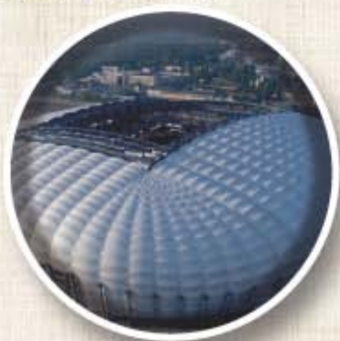
ESTADIO MUNICIPAL (Poznan) Apertura 1980 Aforo 40.000