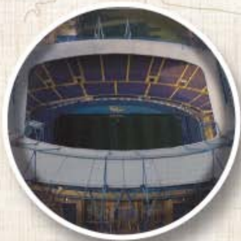
ESTADIO METALIST (Kharkiv) Apertura 1926 Aforo 35.000