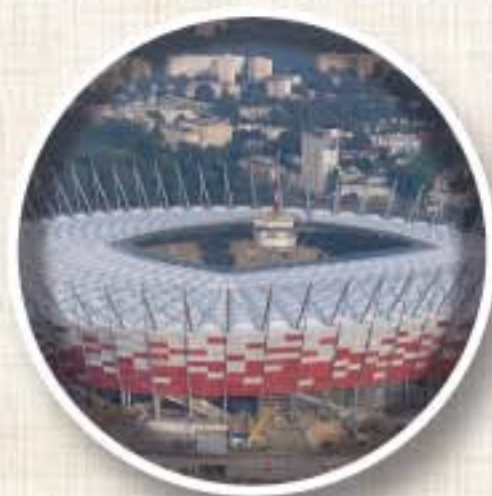
ESTADIO NACIONAL (Varsovia) Apertura 2012 Aforo 50.000