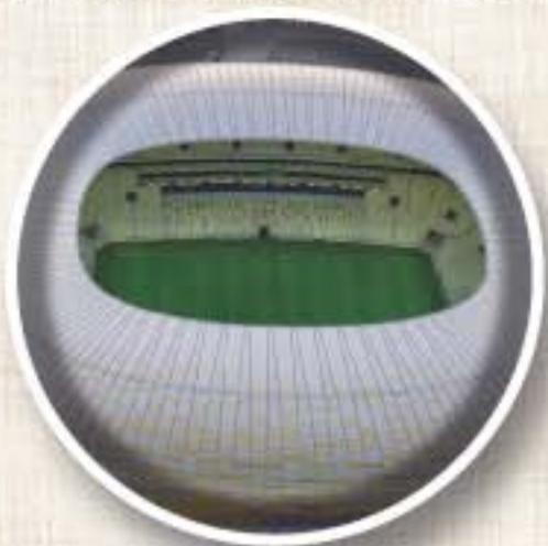
ARENA GDANSK (Gdansk) Apertura 2011 Aforo 40.000

Al igual que en la anterior Eurocopa, dos países aportan sus instalaciones para el torneo. Ocho estadios repartidos entre Ucrania y Polonia.