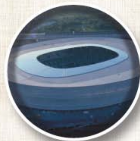
ESTADIO MUNICIPAL (Wroclaw) Apertura 2011 Aforo 40.000