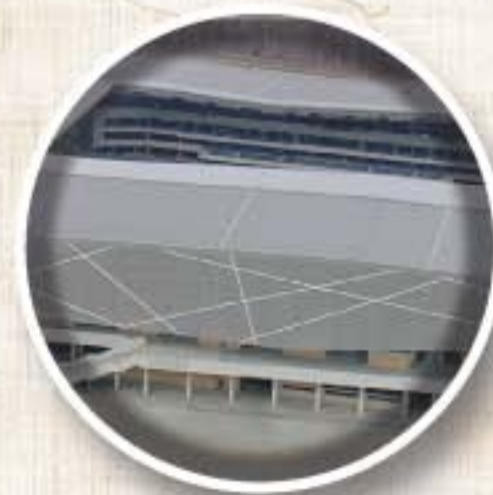
ARENA LVIV (Lviv) Apertura 2011 Aforo 30.000