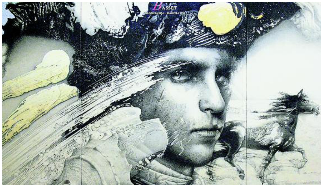
Quadre sobre el general Basset que ocupa l'espai central de l'exposició de Manuel Boix a l'Alcúdia.

El filòsof alemany sostenia que l'aura de l'obra d'art desapareix quan els mitjans de difusió de massa poden construir-ne rèpliques inesgotables. Si més no, el reagrupament de l'obra reproducible hi retorna, per un moment, l'aura i l'endinsa en la