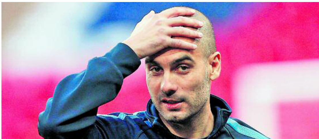
Josep Guardiola.

El Barça d'aquests anys ha sigut un espill on la societat catalana ha vist una imatge millorada d'ella mateixa, i ha vist que aquest bonic somni era possible almenys en la secció esportiva de la realitat. El Barça