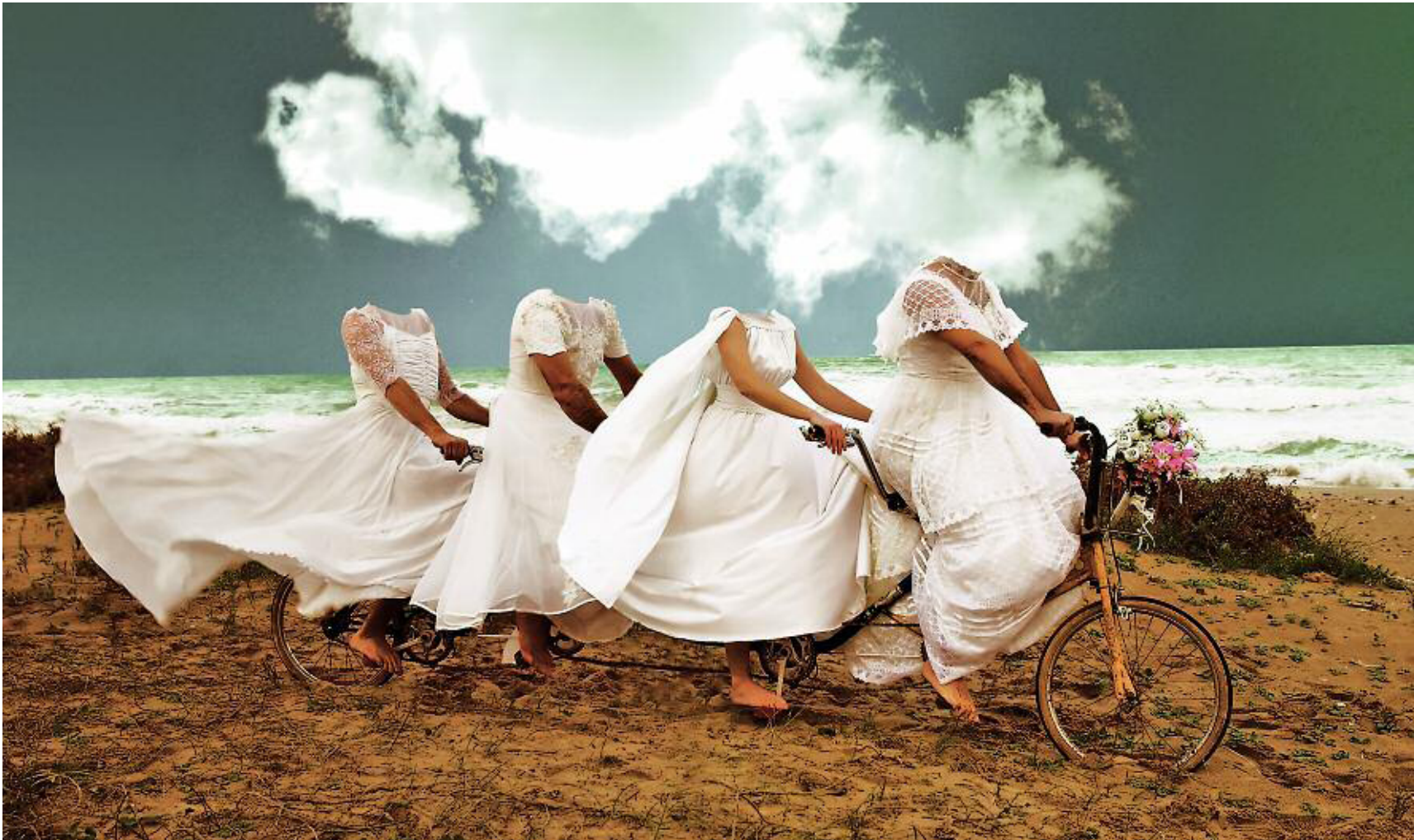
Cartell d' Exercicis d'amor , obra de la companyia El Pont Flotant.