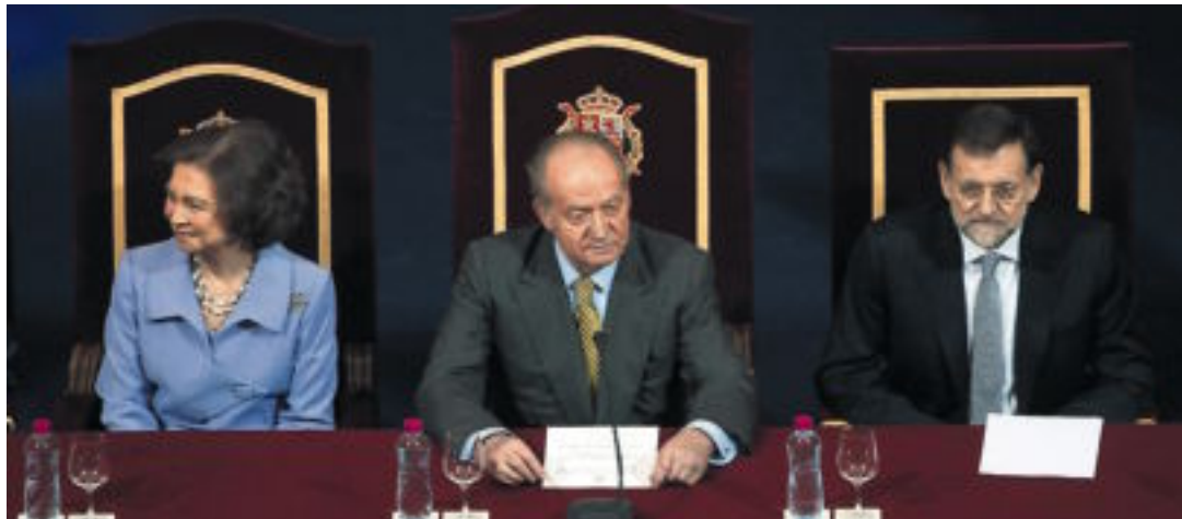
Els Reis d'Espanya i el president del Govern, en el bicentenari de la Constitució de Cadis.

l'austeritat que Brussel·les defensa no és suficient per a traure'ns del mal pas, i que cal fer propostes dinamitzadores. Però quines? No és una pregunta fàcil de respondre, i en tot cas, no sembla que els nostres governants sàpien com fer-ho. Les de l'austeritat i l'enduriment, més que eficaces, semblen receptes fàcils d'imposar. Potser no tant. La irritació dels afectats per la reforma laboral és òbvia. Quant a les retallades, la major part de la factura l'han de pagar unes autonomies que fins ara s'han encarregat de fer possible el nostre relatiu estat del benestar: salut, educació, etc. És la part més costosa de l'administració, i la més necessària. En el cas de Catalunya de la Comunitat Valenciana, amb un dèfi-