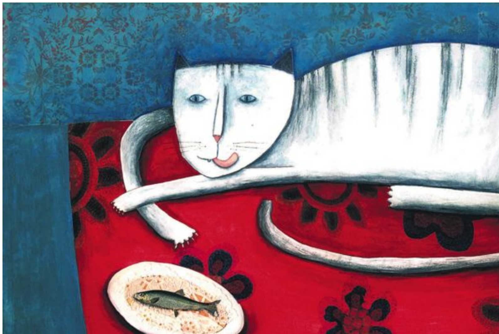
Una de les il·lustracions de Montse Gisbert per a L'Almanagat , àlbum amb text d'Adeline Yzac.