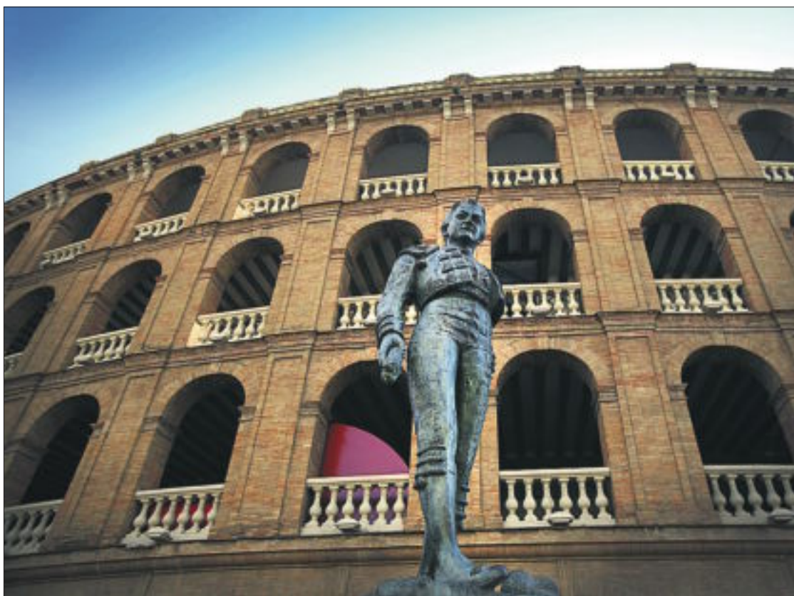
Dalt, una escultura de Ripollés en una rotonda de València. Baix, el banderiller Montoliu.