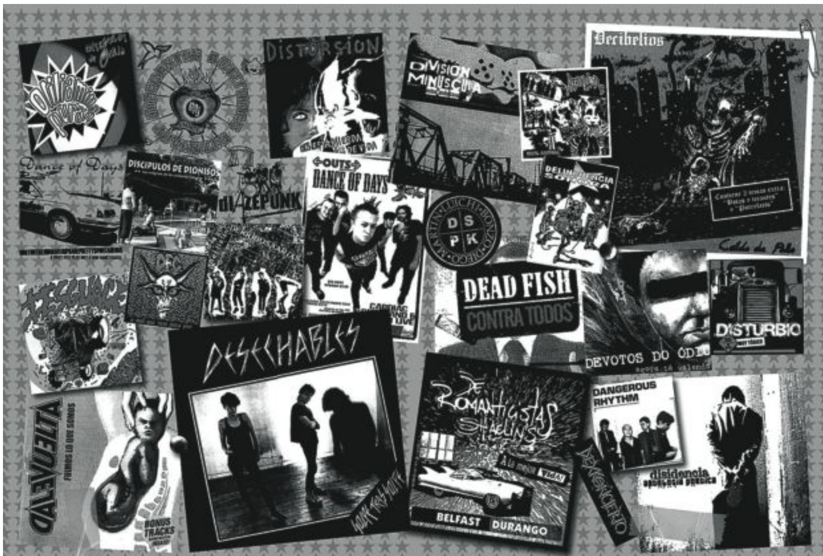
Una de les il·lustracions del Diccionario de punk y hardcore de España y Latinoamérica.