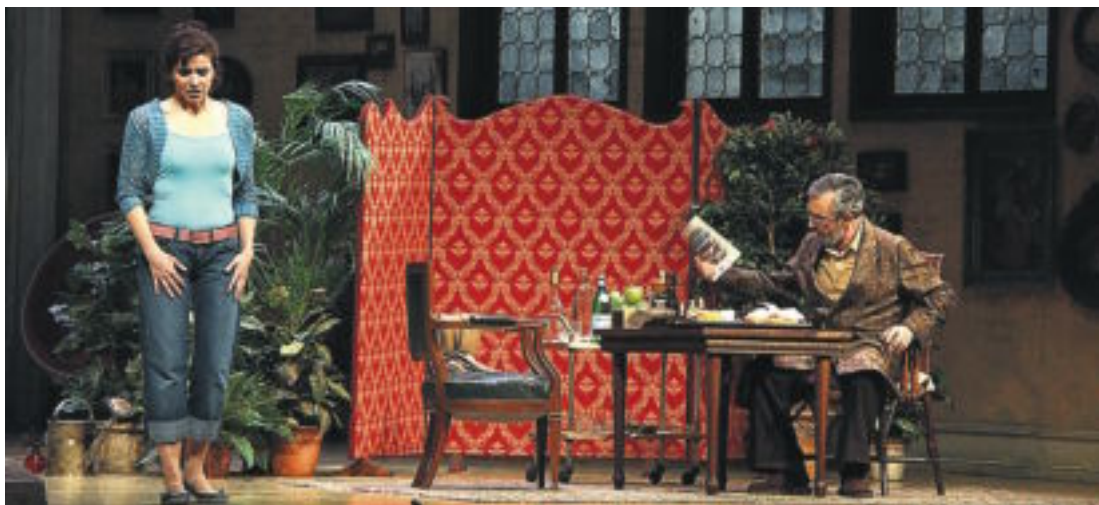
Una escena de l'òpera Il burbero di buon cuore , de Vicent Martín i Soler.

d'òpera amb més tradició d'aquesta part del món. No deixa de ser paradoxal que això passe en un moment en què, a Barcelona, ha augmentat més d'un 8% la xifra d'espectadors de teatre i que una molt bona part d'aquests espectadors ha anat a veure —i escoltar— musicals. Com ja sabien els programadors de Broadway del 1929, les crisis econòmiques solen estimular les cues a les taquilles, perquè la gent vol distraure's de la mala maror. No és el cas del Liceu. L'òpera és més cara, sens dubte, i requereix ajuda pública. Però la sospita d'una mala gestió tampoc s'ha de descartar. Cap altre gran teatre d'òpera europeu ha hagut de suspendre la programació, fins ara. El fet és que la plantilla de treballadors se sent amenaça-